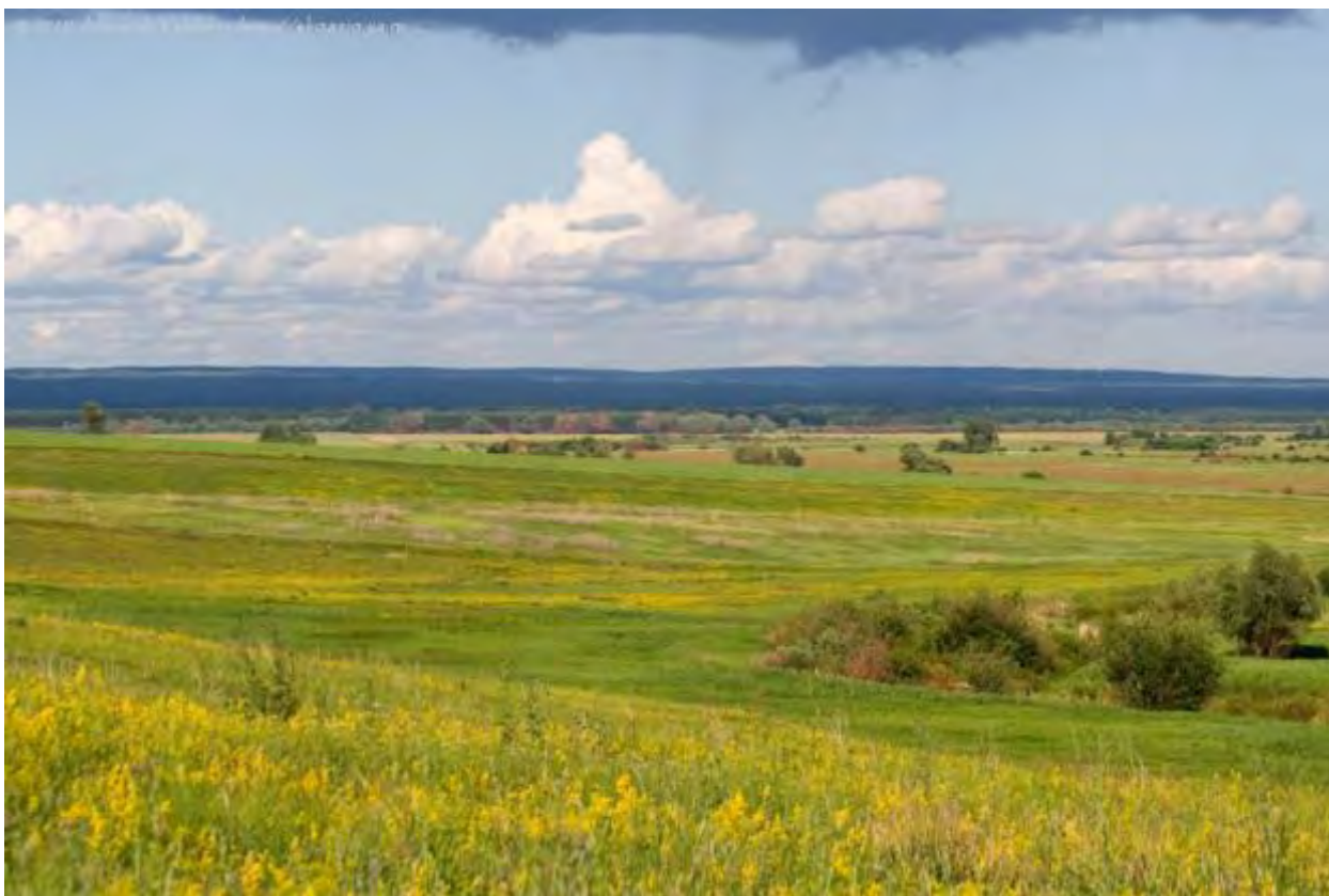
(Окрестности села Большая Елховка)